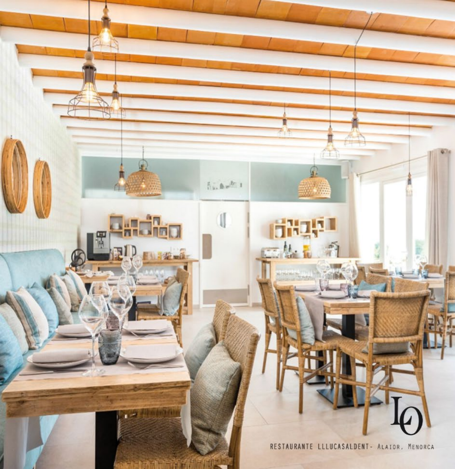
RESTAURANTE LLLUCASALDENT - ALAIOR, MENORCA