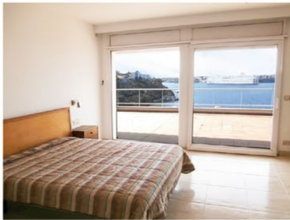
► AMBIENTES ANTES/DESPUÉS PROYECTO RESTYLING VILLA LANTANA, BINIBECA, MENORCA